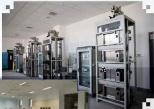
智能电梯安装调试维护训练场所